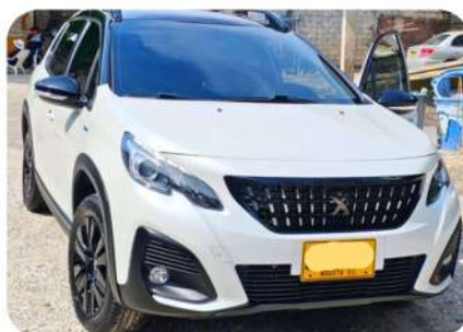
Camioneta SUV Peugeot 2008 Style, modelo 2023