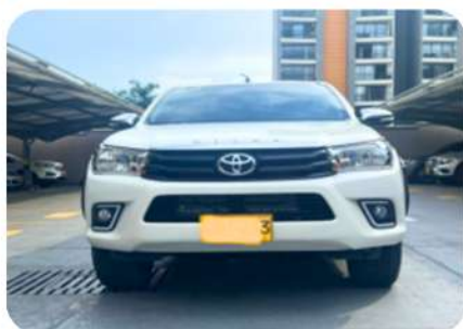
Camioneta Toyota Hilux 2017