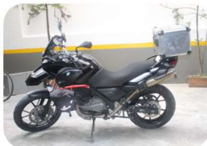
Moto BMW GS 650 modelo 2015