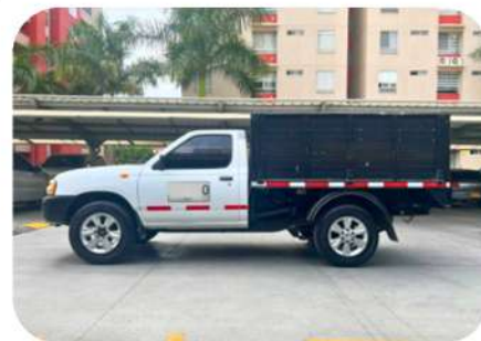
Nissan Frontier Modelo 2012