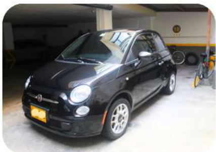
Fiat 500 Cult 8v modelo 2014