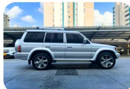
Montero Mitsubishi 2007